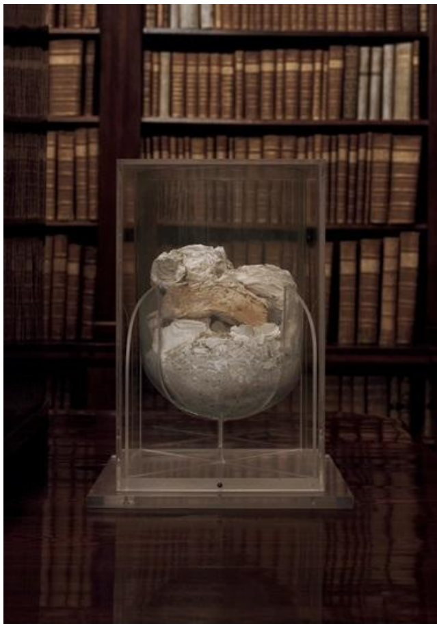
Paweł Bownik, "Bownik/Urna"