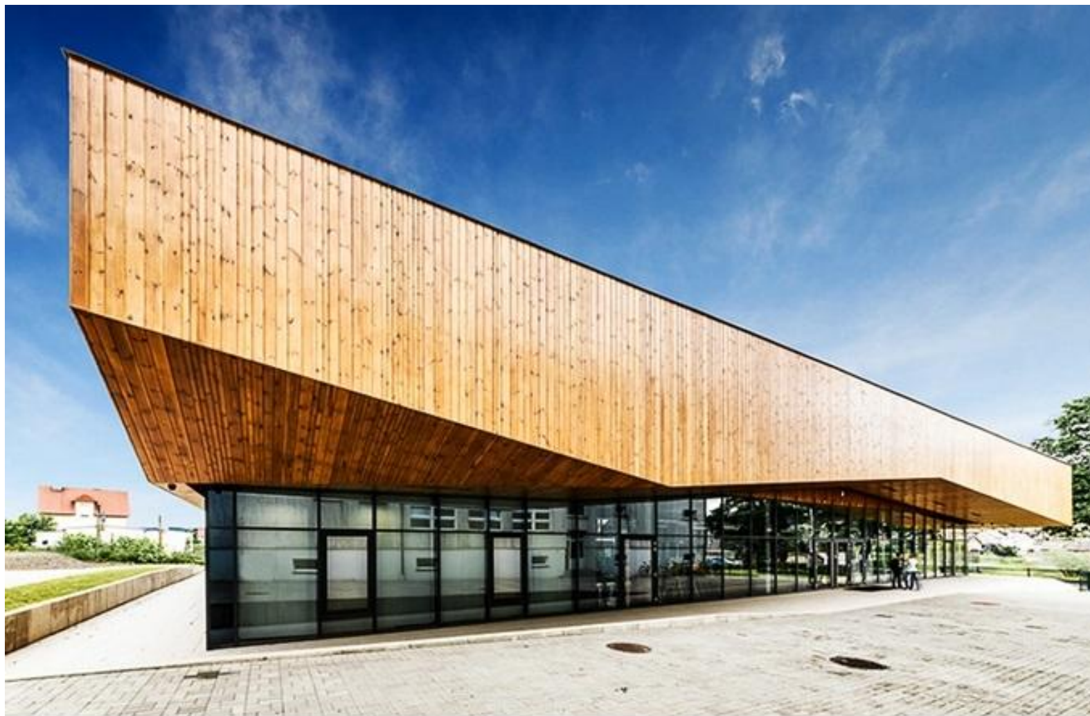
Gminna Biblioteka Publiczna w Czarnym Borze, projekt: ISBA Grupa Projektowa, inwestor: Gminna Biblioteka Publiczna w Czarnym Borze, 2011-2012

Kliknij tu → https://culture.pl/pl/artykul/10-niezwyklych-bibliotek-w-polsce