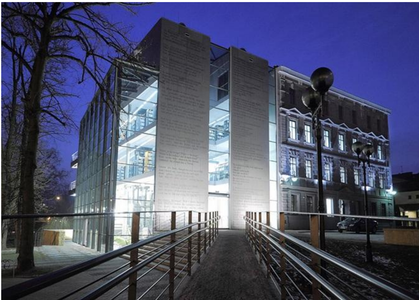
Miejska Biblioteka Publiczna w Opolu: projekt: Architop (Małgorzata Zatwarnicka, Andrzej Zatwarnicki)

Kliknij tu → https://culture.pl/pl/artykul/10-niezwyklych-bibliotek-w-polsce