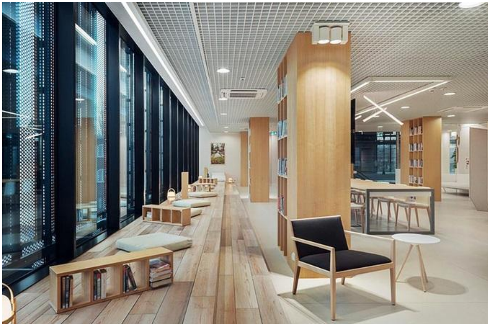
"Sopoteka", aranżacja wnętrza : Jan Sikora

Kliknij tu → https://culture.pl/pl/artykul/10-niezwyklych-bibliotek-w-polsce