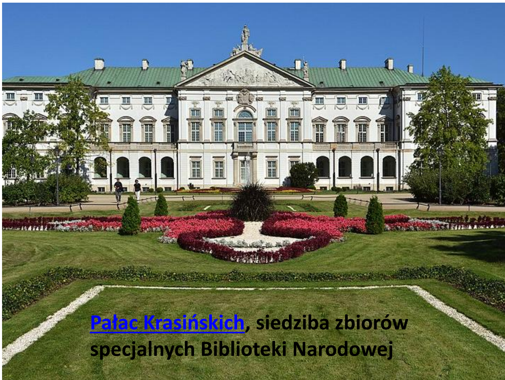
Pałac Kasińskich , siedziba zbiorów specjalnych Biblioteki Narodowej