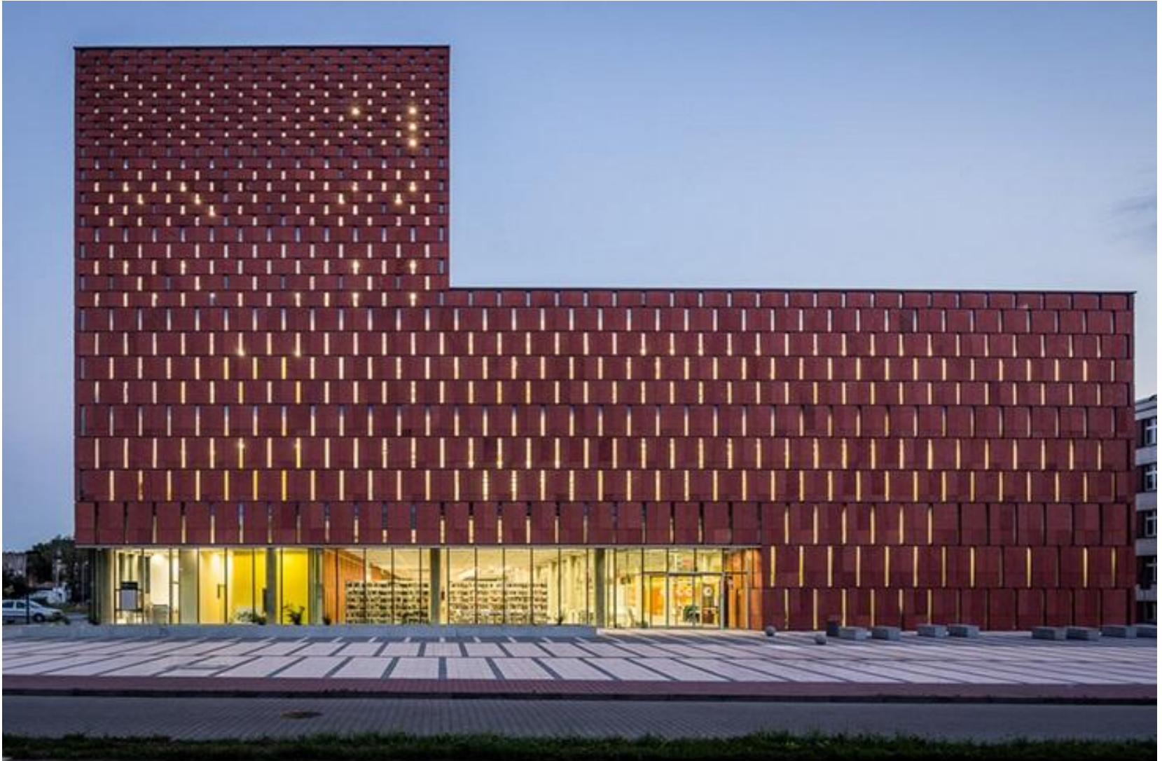
Biblioteka Akademicka w Katowicach

Kliknij tu → https://culture.pl/pl/artykul/10-niezwyklych-bibliotek-w-polsce