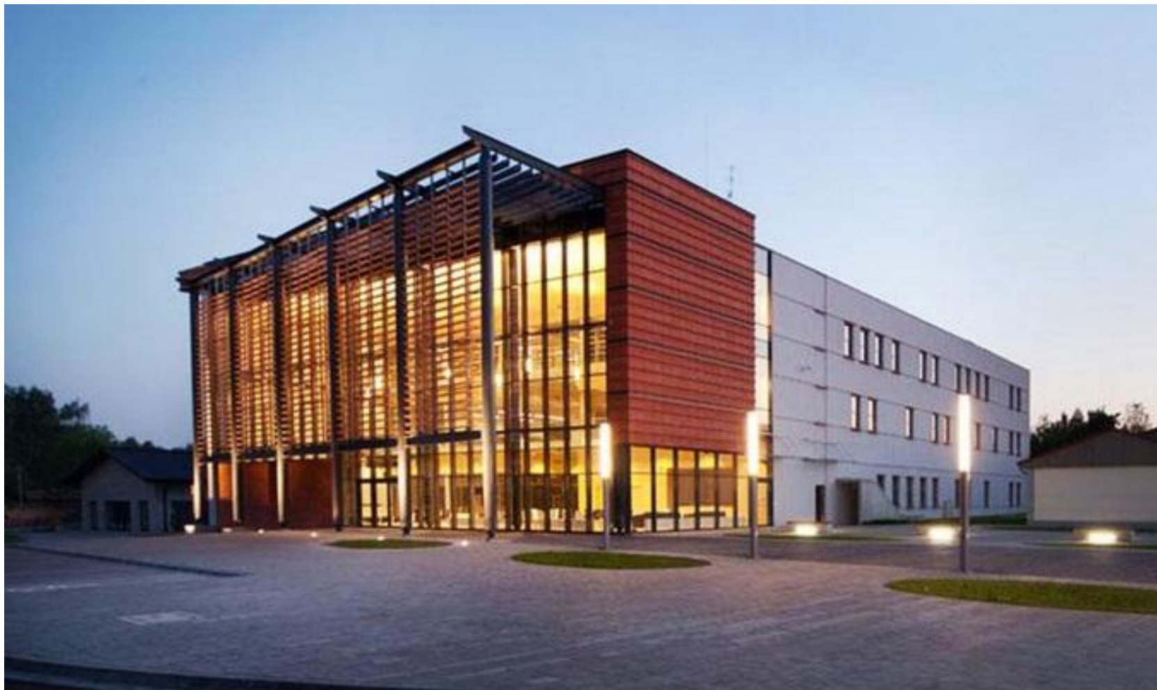
Galeria Książki w Oświęcimiu, projekt: pracownia projektowa S2 Susuł&Strama Architekci

Kliknij tu → https://culture.pl/pl/artykul/10-niezwyklych-bibliotek-w-polsce