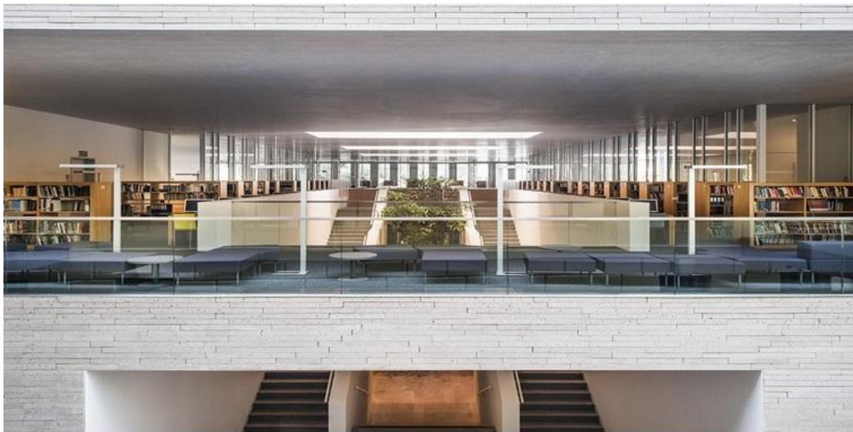
Biblioteka Raczyńskich, Poznań, projekt: JEMS Architekci, fot. Juliusz Sokołowski

Kliknij tu → https://culture.pl/pl/artykul/10-niezwyklych-bibliotek-w-polsce