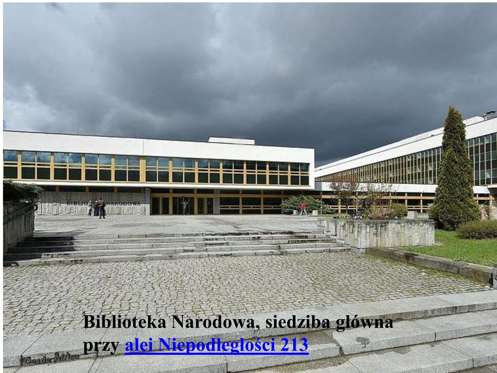
Biblioteka Narodowa, siedziba główna przy alei Niepodległości 213