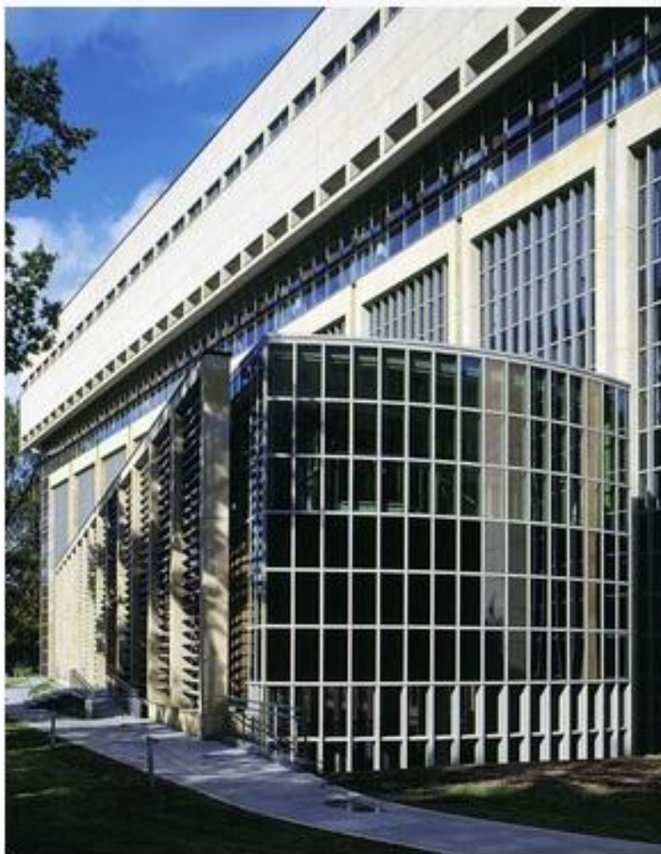
Biblioteka Jagiellońska w Krakowie

Kliknij tu → https://culture.pl/pl/artykul/10-niezwyklych-bibliotek-w-polsce